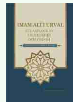
Källa: Boken "Imam Ali i urval" Översättning: Hasanain Govani

Skänk mig [även nu Din nåd], för den saks skull, att Du sedan tidigare varit storsint och i det förgångna varit god mot mig!