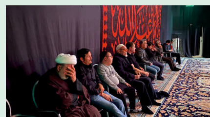
IAC - Muharram 2021

Kände inte de som mördade imam Hussein tillsammans med hjältarna som försvarade honom, vem han var? Visste inte de att det var Profetens älskade dotterson som de var pliktiga att följa och lyda, som de mördade?