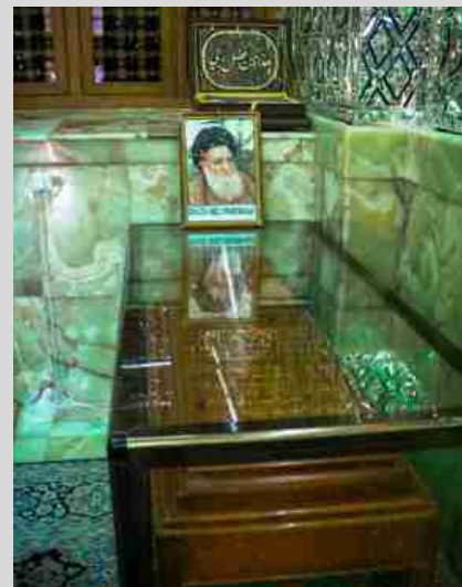
Ayatullah Khoeis begravningsplats i Najaf i Imam Alis helgedom.

Ayatullah Khoei har skrivit många böcker och en av hans populäraste böcker är Mu'jam rijal al-hadith wa tafsil tabaqat al-ruwah, som är på 24 volymer och publicerades år 1953. Boken presenterar fler än 15 000 shiamuslimska hadithförmedlare i alfabetisk ordning och diskuterar deras trovärdighet i att förmedla hadither.