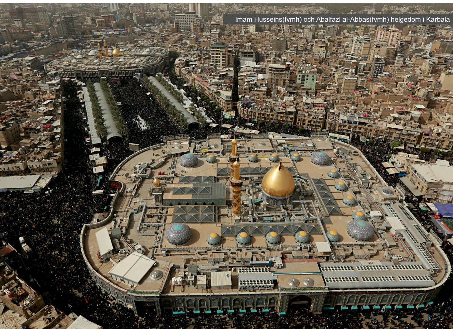
Imam Hussein(fvmh) och Abalfazl al-Abbas(fvmh) helgedom i Karbala